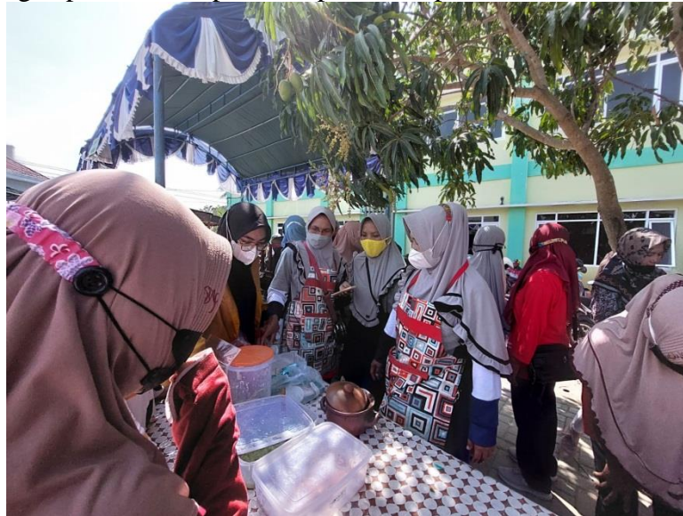
Gambar 4. Pendampingan Pameran Pasar Tani

c. Pendampingan pelaksanaan pameran pasar tani pada hari Jumat, 22 Oktober 2021