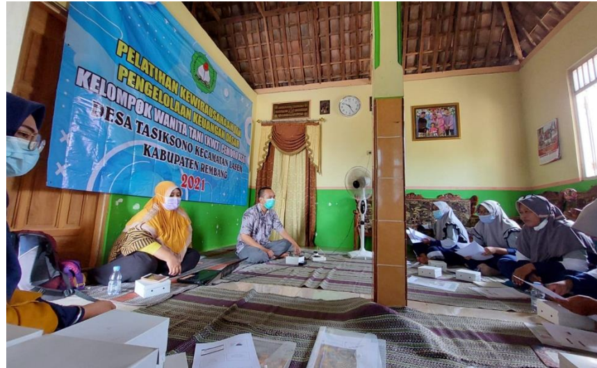
Gambar 3. Pelatihan Kewirausahaan dan Keuangan Dasar

c. Pendampingan pelaksanaan pameran pasar tani pada hari Jumat, 22 Oktober 2021