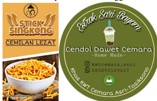
Gambar 5. Desain Kemasan Produk

d. Pendampingan membuat kemasan produk hari Minggu, 21 November 2021