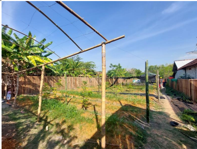
Gambar 2. Kunjungan Awal ke Lokasi KWT Cemara Asri