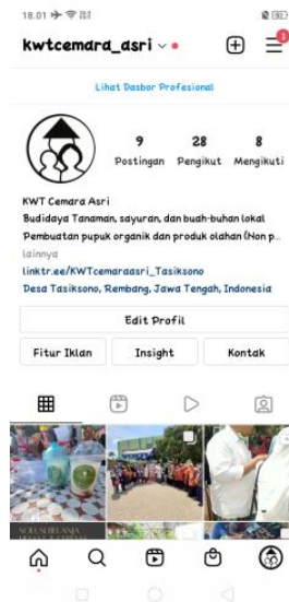
Gambar 6. Pemasaran Online (Instagram)