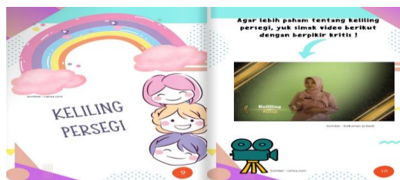
Gambar 1. Materi E-book Dalam Bentuk Video

Pada e-book ini ada 7 video pembelajaran yang melatih kemampuan berpikir kritis siswa karena video berisi peneliti yang melakukan praktik secara langsung mengukur keliling bangun