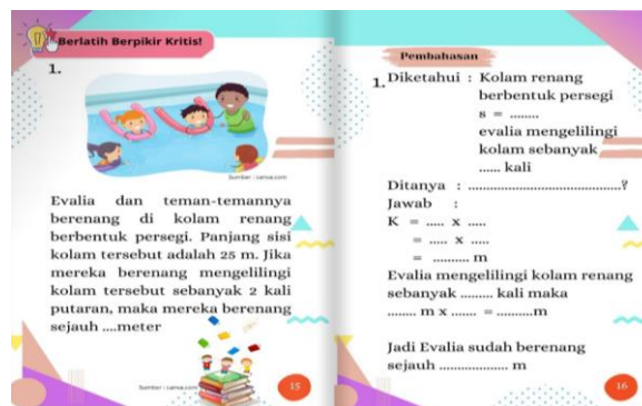
Gambar 3. Latihan Soal Pada E-Book Melatih Kemampuan Berpikir Kritis

Pada media e-book ini materi berupa tulisan dan gambar bertujuan untuk memperjelas penyampaian materi. Siswa tidak hanya berangan-angan, namun dapat langsung mengamati gambar untuk meningkatkan pemahamannya terhadap sebuah materi.