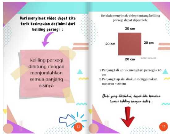
Gambar 2. Materi E-Book Dalam Bentuk Tulisan dan Gambar

datar menggunakan tali dan bangun datar dari kertas buffalo sampai diperoleh rumus keliling bangun datar. Video berisi penanaman konsep yang melatih penalaran siswa untuk lebih berpikir kritis.