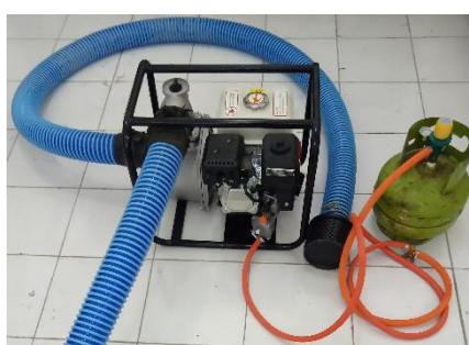
Gambar 3. Mesin pompa air sawah hasil modifikasi

Setelah dilakukan penggantian komponen pencampur bahan bakar dan udara, dengan konverter kit gas LPG dan dilakukan perakitan semua komponen pendukungnya, antara lain tabung gas, selang pipa hisap dan keluar, selang gas LPG beserta regulatornya, maka modifikasi mesin pompa air sawah siap untuk diuji. Mesin pompa air sawah yang telah dimodifikasi dari bahan bakar bensin menjadi bahan bakar gas LPG dapat dilihat pada gambar 3.