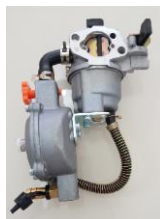
Gambar 2. Konverter kit gas LPG

Konverter kit merupakan alat yang digunakan untuk mengkonversi BBG, agar dapat digunakan untuk mesin yang berbahan bakar minyak (BBM). Pada kendaraan bermotor diperlukan peralatan tambahan, agar dapat memakai BBG sebagai bahan bakar, peralatan tersebut dinamakan konverter kit . Alat ini berfungsi untuk menyesuaikan kerja mesin, sehingga pemakaian BBG dapat diterapkan pada mesin berbahan bakar minyak. Secara umum terdapat dua teknik dalam pemakaian gas sebagai BBG, yaitu: gas dihisap (sistem vacum ) dengan menggunakan efek vacum pada ruang bakar dan gas diinjeksikan ke dalam ruang bakar ( sistem injeksi ) (Mahmud & K, 2015). Konverter kit dengan teknik dihisap dengan memakai teknik vakum dapat diterapkan pada motor penggerak mesin parut kelapa yang menggunakan bahan bakar gas (Rijanto & Efendi, 2018). Konverter kit dapat dilihat pada gambar 2 berikut.