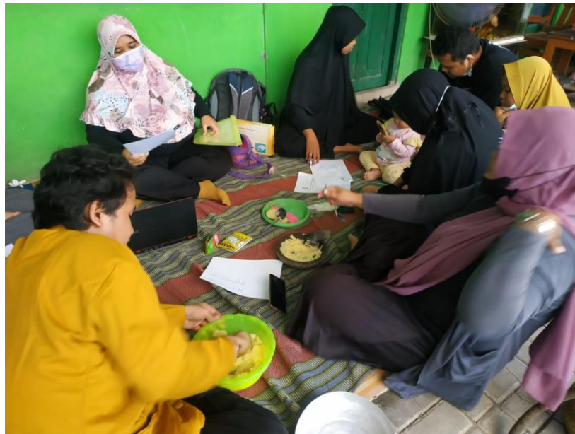
Gambar 1. Praktek Pembuatan Produk Stik Kentang

Peserta dilatih membuat produk stik kentang keju mulai dari awal pengolahan sampai pada proses finishing dan pengemasan. Dalam proses pelatihan ini peserta memperoleh keterampilan dan pengetahuan tentang bagaimana memilih bahan, belanja bahan, proses menyiapkan bahan, proses memasak dan proses pengemasan.