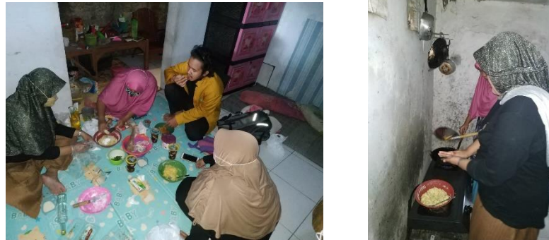
Gambar 4 Pelatihan Tambahan Inovasi Produk