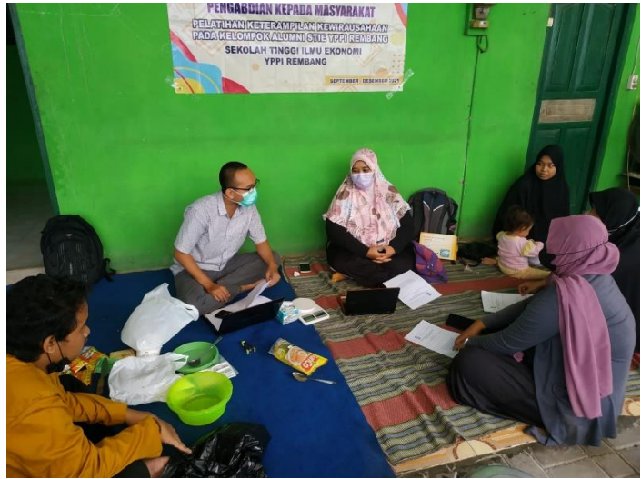
Gambar 2. Pelatihan Penetapan Harga Pokok dan Harga Produk