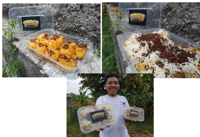
Gambar 5 Aneka Varian Produk Capociz

Dalam pelatihan pemasaran online dan offline peserta mendapatkan teknik-teknik pemasaran online dan offline . Untuk menunjang pemasaran online, peserta membuat akun sosial media khusus mempromosikan produk, sebelum itu telah ditentukan merek produk yaitu Capociz, nama ini diambil dari singkatan Casava (Singkong), Potatto (Kentang), Ciz (Cheese, Keju). Akun sosial media meliputi facebook dan instagram, sedangkan untuk marketplace sementara masih menggunakan shopee. Dalam pelatihan tambahan inovasi produk dihasilkan berbagai macam inovasi produk dengan bahan baku singkong dan keju. Aneka varian produk ini diharapkan mampu bersaing di pasar.