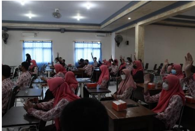
Gambar 4. gambar foto kegiatan Sosialisasi DPM di SMAN 2 Jombang