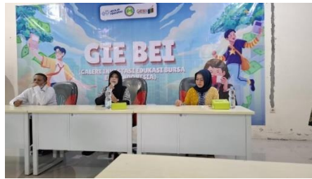
Gambar 1. Foto Kegiatan Sosialisasi DPM

melakukan penyebaran informasi mengenai dunia investasi di pasar modal memiliki kemampuan basic yang baik dan sesuai (Otoritas Jasa Keuangan 2017).