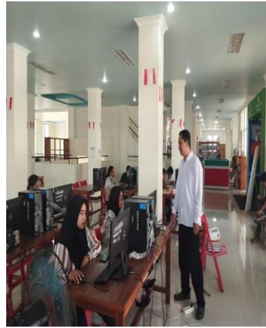
Gambar 4. Penjelasan Tentang Animasi dan Transisi