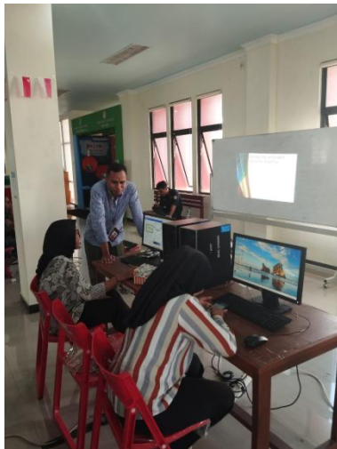
Gambar 5. Praktik Membuat Paparan dengan Power Point