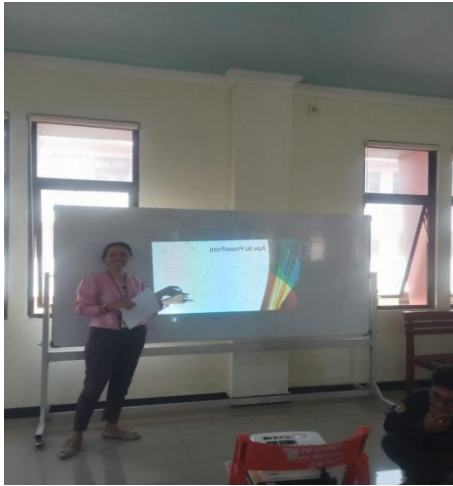
Gambar 3. Penjelasan Tentang Power Point