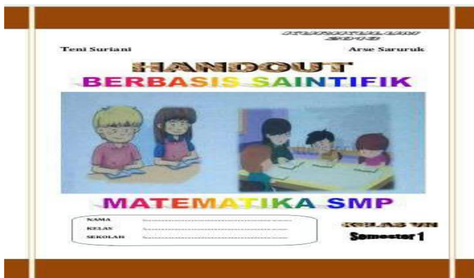
Gambar 1. Design Cover Handout