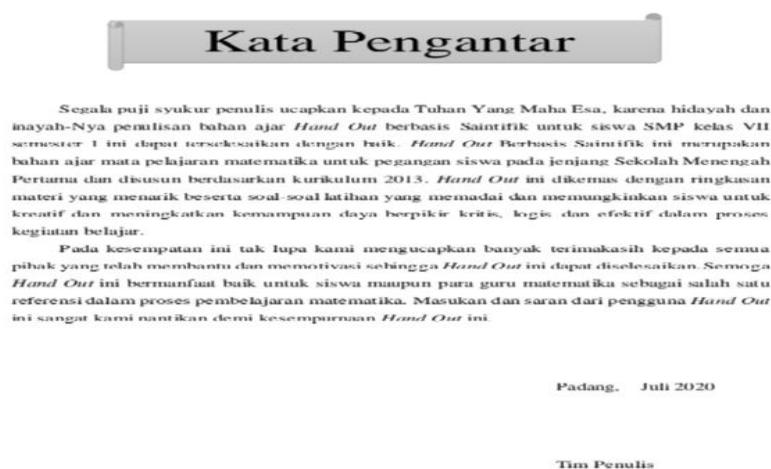
Gambar 2. Kata Pengantar

Kata pengantar dibuat di aplikasi Microsoft word di tulis berjenis huruf Times New Roman dengan desain berikut ini: