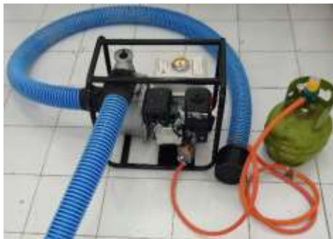
Gambar 2. Mesin pompa air sawah berbahan bakar bensin dan gas

dengan menggunakan bensin menjadi pembakaran yang menggunakan gas LPG. Selang masuk ( suction ) dan selang keluar ( discharge ) air, berupa selang berbentuk spiral yang terbuat dari plastik digunakan pada pipa masuk dan pipa keluar pada mesin. Gas LPG dalam tabung ukuran 3 kg, digunakan sebagai bahan bakar mesin modifikasi. Regulator gas LPG high pressure , digunakan untuk mengatur pemakaian gas LPG, yang dihubungkan langsung dengan katup tabung LPG. Selang gas LPG high pressure , digunakan untuk media aliran gas LPG ke konverter kit pada mesin. Karet ban, digunakan untuk pengikat pada selang pipa masuk dan keluar, agar tidak terjadi kebocoran. Valve /kran puyer gas LPG digunakan untuk mengatur gas yang menuju konverter kit . Oli mesin digunakan sebagai pelumas mesin. Packing karburator dipasang saat mengganti karburator bensin dengan karburator LPG, agar tidak terjadi kebocoran. Klem selang LPG, digunakan untuk mengikat sambungan selang dengan regulator dan konverter kit . Klem selang kawat, digunakan untuk mengikat selang air masuk dan keluar, agar terikat lebih kuat. Bak penampungan air, digunakan untuk menampung air yang dihisap dan dilepas. Pompa air sawah berbahan bakar bensin dan gas ditunjukkan pada gambar 2.